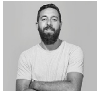
ÁNGEL MARTÍNEZ Fotografía de moda

Periodista especializada en moda y estilo de vida, colaboradora en Los 40 Principales, Fashion United, Esquire y Rabat Magazine. También ha escrito para Condé Nast Traveler, Elle Gourmet, EGO, Nylon Spain, GQ y Vogue, entre otros medios.