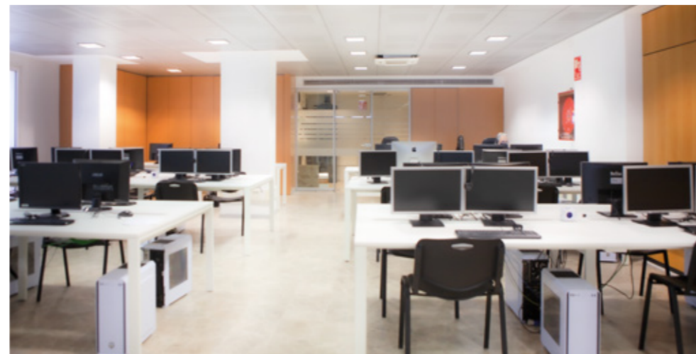
AULA DE INFORMÁTICA