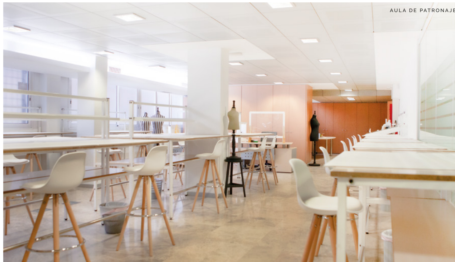
AULA DE PATRONAJE

Las materias impartidas por Escuela Guerrero en Patronaje están completamente orientadas a la industria, y responden a las exigencias y a la actividad diaria de la empresa moderna.