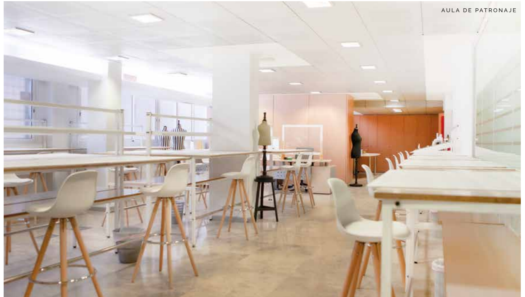
AULA DE PATRONAJE

Las materias impartidas por Escuela Guerrero en Patronaje están completamente orientadas a la industria, y responden a las exigencias y a la actividad diaria de la empresa moderna.